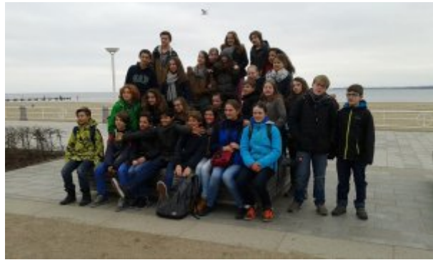
Promenade dans la vieille ville de Lübeck, capitale de la Ligue hanséatique, (très) à l'écoute des explications de notre guide.