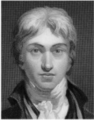
J.M.W. Turner R.A. 1775 - 1851