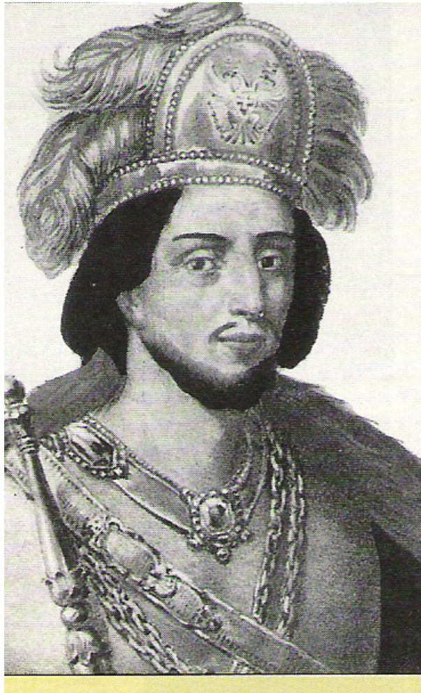
Portrait de Montezuma

Le grand Montezuma avait environ quarante ans ; il était d'une stature au-dessus de la moyenne, élancé, un peu maigre, avec de l'harmonie dans les formes. Son teint n'était pas très foncé et ne s'éloignait nullement de la couleur habituelle de l'Indien. Il portait les cheveux un peu longs, descendant seulement de manière à couvrir les oreilles. Il avait la barbe rare, noire et bien plantée. Son visage était gai et d'un ovale un peu allongé. Son regard avait de la dignité, témoignant d'ordinaire de sentiments de bienveillance et prenant de la gravité lorsque les circonstances l'exigeaient. Il était propre et bien mis ; il se baignait tous les jours une fois dans l'après-midi.